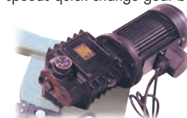
Boîtier d'engrenage à changement rapide à trois vitesses