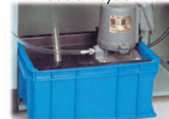
Système de refroidissement