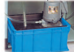
Système de refroidissement