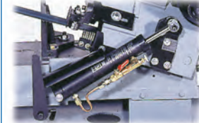
Contrôle ajustable pour le système hydraulique